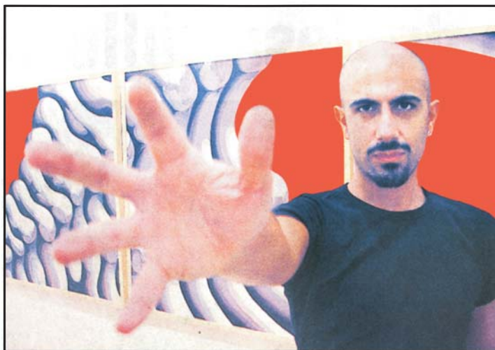
Hasta el 15 de junio podremos ver la obra de Blasi en Ca n'Oms de Petra.

En “Apuntes para una nueva biología”, Blasi conjuga con total libertad organismos imaginarios y estructuras orgánicas